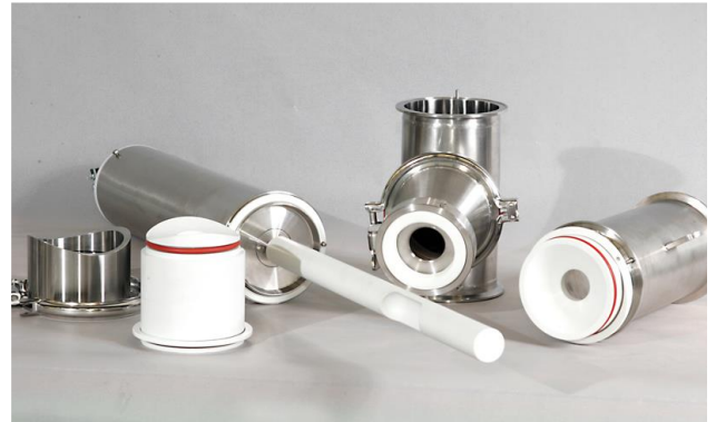
Probenehmer vollständig zerlegt