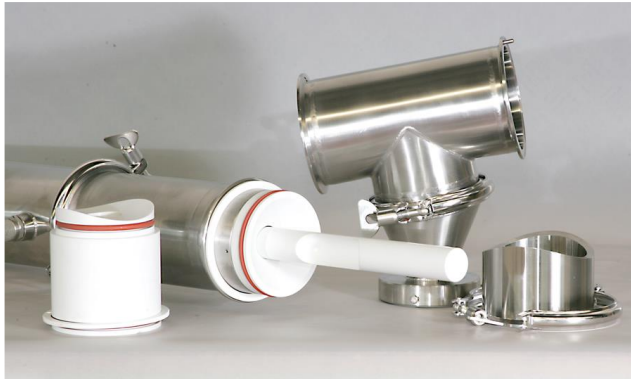
Einschweissteil und Abwurfkammer demontiert